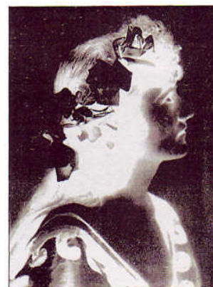
Positivo e negativo fotografico

Solo Carl Scheele, in Svezia, scoprì la proprietà dell'Ammonio come agente fissativo che rendeva permanente l'immagine.