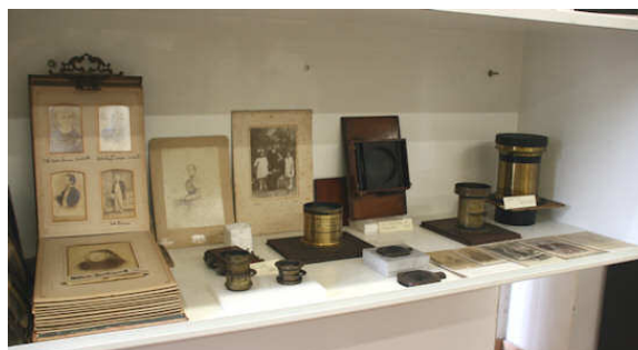
I primordi della fotografia

Il Vasari cita Leon Battista Alberti come l'inventore della camera oscura nel 1457, mentre Leonardo da Vinci la descrive nei suoi appunti.