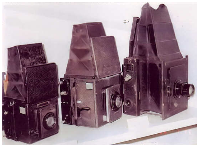
Macchine Reflex, con visione dell'immagine dall'alto

Naturalmente a diaframma stretto entra meno luce e quindi si deve allungare il tempo di esposizione dell'immagine. Una volta si leggevano le regolazioni diaframmi-tempi su apposite targhette o scritte sul corpo della macchina o sugli obiettivi mentre oggi, grazie ai computer inseriti nelle macchine fotografiche, si ottiene il meglio per ogni fotografia che desideriamo scattare praticamente senza fare nulla.