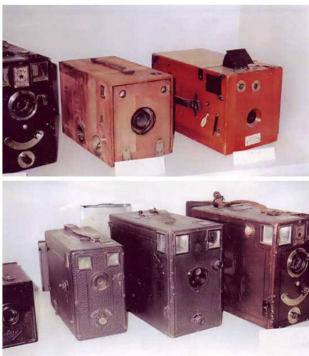
Macchine fotografiche a cassetta

Parecchie, fra le macchine esposte nel Museo, lavoravano su lastre di vetro ed i fotografi portavano con sé un recipiente con la miscela da spalmare sul vetro, in un posto oscuro, prima di iniziare a fotografare.