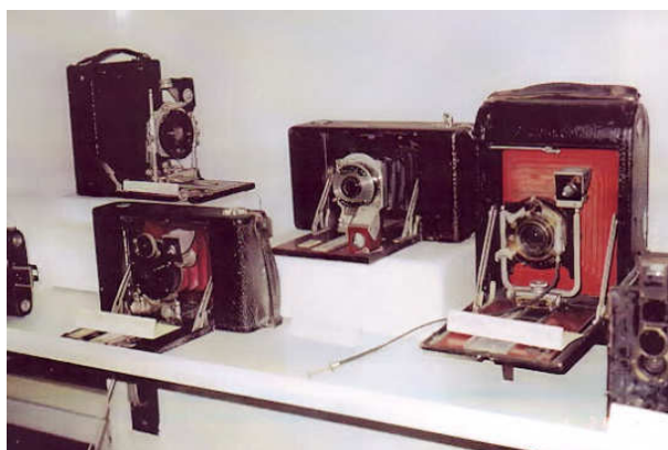
Macchine a soffietto per pellicola a rullo