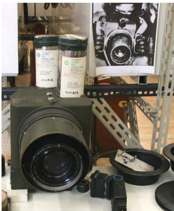
Macchina a grande formato per foto da aerei

Poi una vetrina è dedicata alle macchine fotografiche per pellicole da 35 mm ed un'altra alla macchinette 35 mm "usa e getta", alle microcamere ed alle macchine digitali con memoria a dischetto e simili.