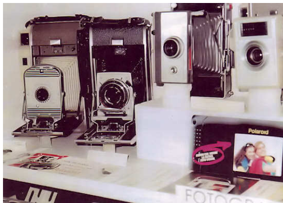
Fotografia istantanea (Polaroid e Kodak)

Le macchine a cassette furono le più semplici ed ovviamente le prime ad essere commercializzate ed anche dopo anni di progresso rimasero sempre adatte ai principianti. Vi sono diversi tipi di macchine a soffietto. Quelle in legno di grande dimensioni erano impiegate negli studi fotografici, mentre le più piccole, anch'esse in legno, erano "macchine da campagna", cioè da viaggio. Sono tutte a lastre in vetro.