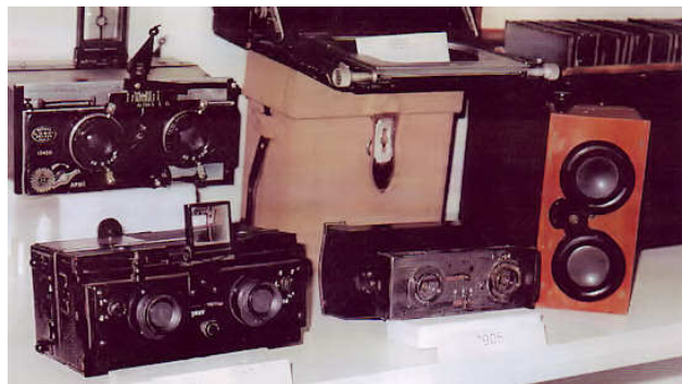
Macchine per fotografia stereoscopica (tridimensionale)

Ma questo non è tutto. Una fotografia ad un soggetto vicino, in piena luce ed una foto allo stesso soggetto ma più lontano ed all'ombra sono due cose diverse, con risultati diversi se non si considera un altro fenomeno di cui oggi noi non ci occupiamo più perchè ci pensa il computer della macchina fotografica.